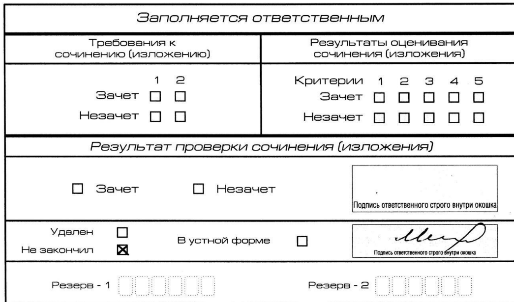
Рис. 10. Заполнение полей нижней части бланка регистрации (участник не закончил написание сочинения (изложения) по уважительным причинам)

Внесение отметки в поле «Не закончил» подтверждается подписью члена комиссии по проведению ИС(И) (см. рис. 10).