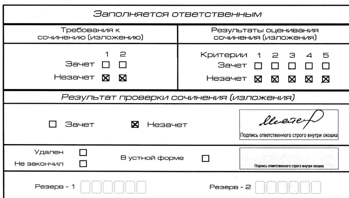
Рис.6. Область для оценки работы

В поле «Результат проверки сочинения (изложения)» ставится «незачет» (см. рис. 7).