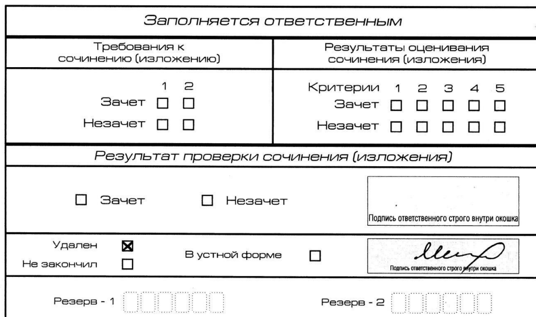
Рис. 11. Заполнение полей нижней части бланка регистрации (удаление с экзамена)

В бланке регистрации указанного участника ИС(И) необходимо внести отметку X в поле «Удален». Внесение отметки в поле «Удален» подтверждается подписью члена комиссии по проведению ИС(И) (см. рис. 11).