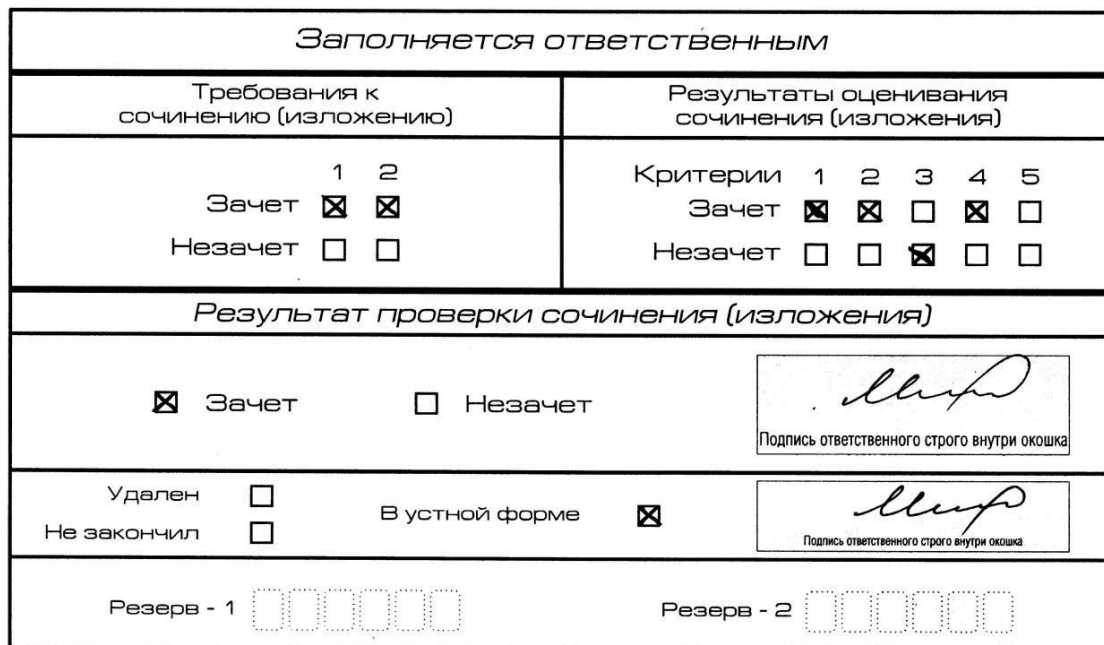
Рис. 9. Область для оценки работы сочинения (изложения) в устной форме

После окончания заполнения бланка регистрации ответственное лицо ставит свою подпись в специально отведенном для этого поле.